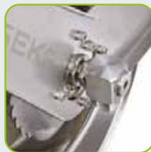
GEKA® plus Winkeldreharmatur und Rohr aus Edelstahl