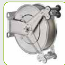
Für Wand-, Boden- und Deckenmontage geeignet