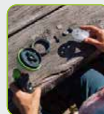
Clean + Repair*