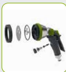
Inside + outside metal