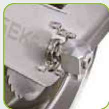
GEKA® plus Winkelrehamatur mit vollem 3/4" Wasserdurchfluss