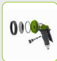
Inside + outside metal