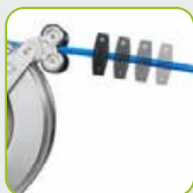
Automatischer Rückzug des Schlauchs