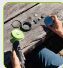
Clean + Repair*