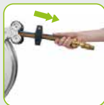
Arretierung durch Zug am Ende des Schlauchs steuerbar