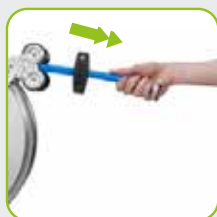
Arretierung durch Zug am Ende des Schlauchs steuerbar