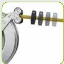
Automatischer Rückzug des Schlauchs