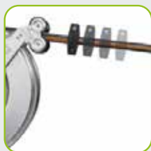
Automatischer Rückzug des Schlauchs