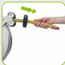
Arretierung durch Zug am Ende des Schlauchs steuerbar